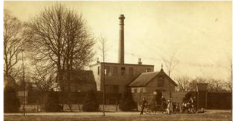
Schoorsteen wasbeetsfabriek 1910

namelijk het maken van porseleinen (Delftsblauwe) tegels. Voor het bakken had hij een flinke oven nodig en daar hoorde de schoorsteen bij. Die moest hoog zijn, want er kwam rook uit de oven die tot 1200 graden opgestookt werd. Het bleef trouwens vooral bij een hobby, want het is Mensing nooit gelukt om het echte porselein te maken.