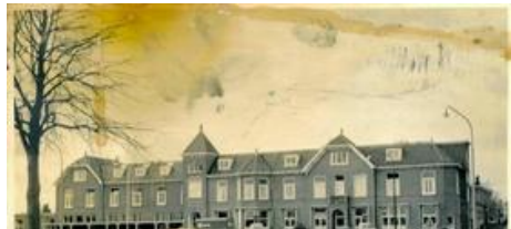
Het Juliana ziekenhuis circa 1960