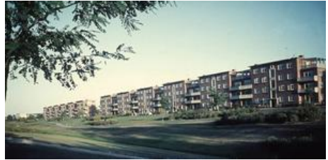
Portiekflats aan de Sprengweg

In 1952 wordt aan de nieuwe Sprengparklaan de eerste hoogbouw in Apeldoorn gerealiseerd. Voor de flatbewoners fungeert het park als gezamenlijke tuin. Aan de noordkant van het park wordt de Sprengweg onder de naam Kennedylaan verlengd richting Jachtlaan. Zowel de flatwoningen als het park zijn inmiddels gemeentelijk monument geworden.