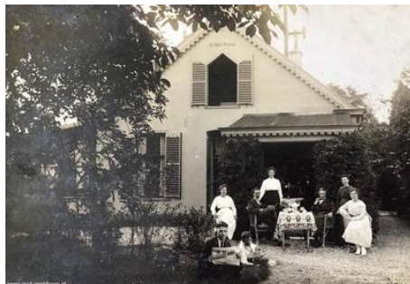
Javalaan nr 6 circa 1925

Daarna ging het huis nog een aantal keren in andere handen over.