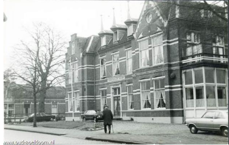
Koningin Wilhelmina rusthuis

In 1899 werd het Koningin Wilhelmina-Rusthuis geopend aan de Soerenseweg waar nu Berkenhove ligt. In het tehuis was geen georganiseerde medische of verpleegkundige zorg. Er waren eigen kamertjes voor mannen, vrouwen en echtparen. De meubilering was sober maar voor die tijd voldoende: een ledikant, een wastafel, een stoel en een kastje. Het huishouden werd bestierd door een echtpaar, dat aangesteld werd als 'vader en moeder'. Ook de