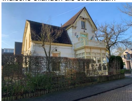
Typisch huis Indische Buurt

De Indische Buurt is in 2002 door de gemeente aangewezen als beschermd stadsgezicht.