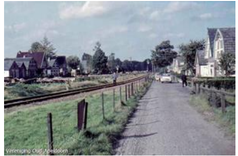
Koning Lodewijklaan circa 1960

Links op de kruising Koning Lodewijklaan en Soerenseweg aan het begin van de Koning Lodewijklaan zie je nog het voormalige spoorwachtershuis.