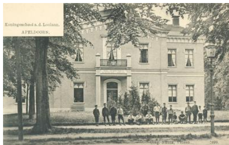
Voorkant van de school aan de Loolaan

De school is tegenwoordig een luxueus pand met 34 riante appartementen.