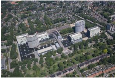
Walterboschcomplex 2006 (Hans Snelleman)

woonzorgvoorziening. Daarbij wordt rekening gehouden met de historie van het gebouw. Het moet bijvoorbeeld duidelijk zijn dat de balkons van de appartementen in 2025 zijn gebouwd en niet in 1963. De balkons worden gemaakt van gebogen glas. Aardig detail zijn de ponskaarten, waarmee vroeger de computers van de Belastingdienst werden aangestuurd, die terugkomen als patroon in het balkonglas. De twee torens aan de John F. Kennedylaan 8 zijn nog in gebruik bij de Belastingdienst. In het pand John F. Kennedylaan 32 is onder meer de prikpoli van het Gelre Diagnostisch Centrum gehuisvest.