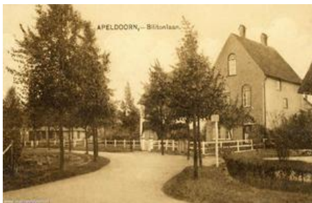
Billitonlaan nr 37 Huis de Linde. Circa 1925

Een fraaie glas-in-lood-deur in de huiskamer laat een rank vogeltje met lange staart zien: de nachtegaal.