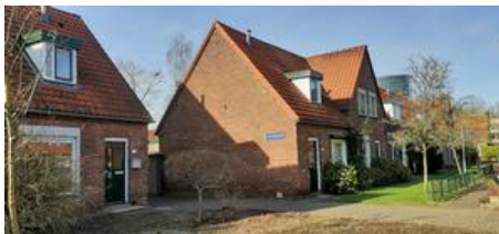
Pad naar Ons Sprengenhok

Het Sprengendorp tussen Asselsestraat en Sprengeweg bestaat al meer dan honderd jaar en telt 141 woningen. Hoewel de naam anders suggereert, hoort deze buurt bij de wijk Orden, maar het is te bijzonder om niet in deze Atlas te worden opgenomen. In de jaren 80 van de vorige eeuw lag sloop van woningen op de loer. Zover kwam het niet en in 1985 was het zelfs de eerste Apeldoornse buurt die op de Monumentenlijst kwam te staan. Er is een actieve belangenvereniging met een eigen clubhuis: Ons Sprengenhok.