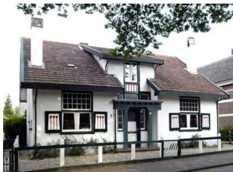
Huis De Klaproos