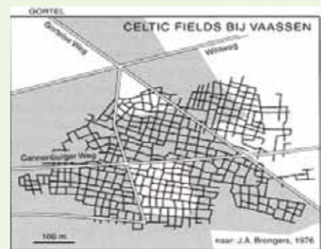
Uit: Michiel Hegener 1995: Archeologie van het landschap, pag. 45

op de Veluwe nog steeds aangetroffen. Binnen de gemeente Apeldoorn kenden we, tot voor kort, geen enkele Celtic Field, dit terwijl bijvoorbeeld in zowel de gemeente Ede als Epe ze alom bekend zijn. Tijdens de actualisatie van de archeologische beleidskaart lijkt het er nu echter op dat we ook in Apeldoorn nog de restanten van dergelijke akkertjes hebben, en wel ten noorden van Hoog Soeren.