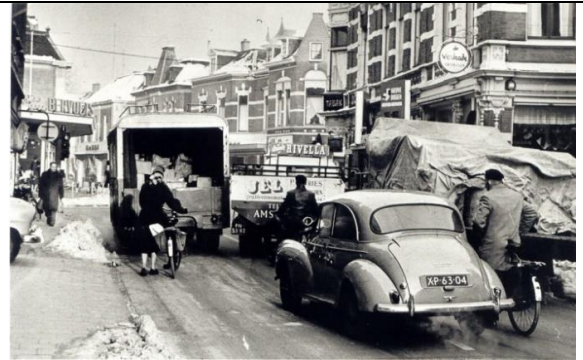
Kruispunt Hoofdstraat met de Deventersraat (rechts) en Korenstraat (links). Rechts de toenmalige winkel van Verkade op Hoofdstraat 126 (nu de burens van Simon Lévelt koffie en thee), 1960