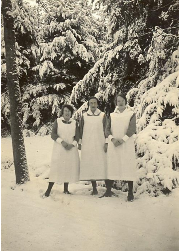
Verpleegsters van het sanatorium Rustoord van het Apeldoornsche Bos, 1924-1927

Bron: CODA Beeldbank: Apeldoorn in beeld