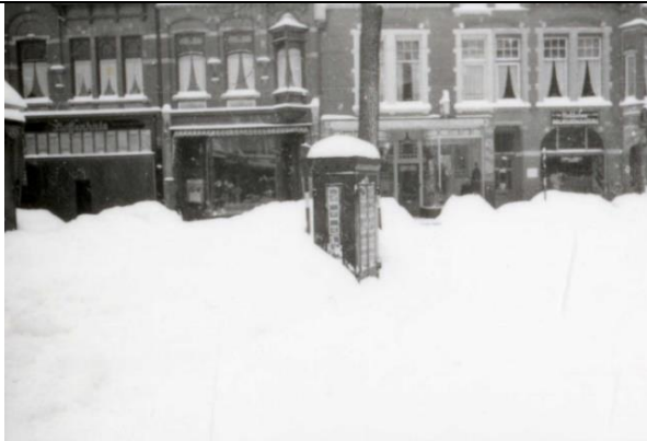
Hoofdstraat vanaf de Paslaan gezien met de tijdschriftenbrievenbus. Rechts stond Noteboom (nu gemeentelijke fietsenstalling), februari 1942