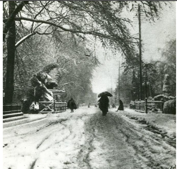
Hoofdstraat ter hoogte van de Kustersbrug (tegenwoordig kruispunt Hoofdstraat-Hofstraat) richting noorden, 1900.