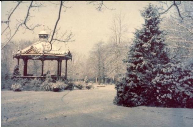
Oranjepark met de voormalige muziektent, 1940