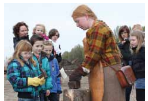
Zelf smeden bij de Germaanse smid.