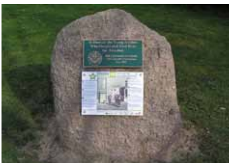
Luisterkei Koning Lodewijklaan.

De Liberationroute volgt het pad dat de geallieerden bewandelden tijdens de bevrijding van Europa. De route laat u beleven wat zich in 1944 en 1945 afspeelde rondom Arnhem, Nijmegen en de Veluwe. Op 49 locaties in de wijde omgeving liggen veldkeien, de zogenoemde luisterplekken. Op iedere luisterplek is een hoorspel te beluisteren over de indrukwekkende belevenissen van één of meerdere personen in de jaren 1944-1945.