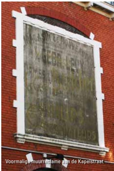
Voormalige muurreclame aan de Kapelstraat

betekenen. De gemeente Apeldoorn is van plan ook de wijkraden en de eigenaren van de kleine monumentale objecten aan te schrijven om aandacht te vragen voor dit kwetsbare erfgoed. Een overzichtlijst is te raadplegen op onze site. Hierop staat ook een aantal muurreclames.