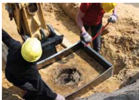
De ijzeroven, alleen de onderkant is in de grond bewaard, wordt en bloc gelicht.