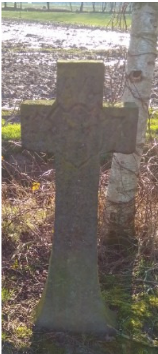
Hagelkruis, dit zou vernieling van het gewas door hagel voorkomen