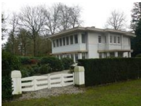
Villa De Essenhoek

6. Tegenover de Berg en Bosschool aan de Soerenseweg ligt nog een rijksmonument: villa De Essenhoek: een opmerkelijke witgepleisterde vierkante villa met inpandige balkons. De villa heeft een curieuze bouwgeschiedenis. Het werd namelijk gebouwd in opdracht van de Rotterdamse Landbouw- en Handelsbank en diende als hoofdprijs van een lotto die door deze bank werd georganiseerd. Toen de gelukkige winnaar voor contant geld koos, werd de villa verhuurd aan de bekende toneelspeler Louis Bouwmeester, die er overigens maar een jaar heeft gewoond.