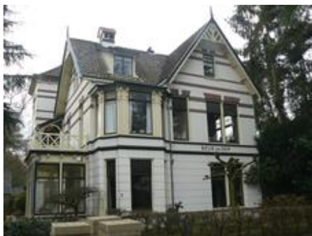
Villa Beuk en Den

Aan de rechterkant ziet u de grote witgepleisterde villa Beuk en Den. Dit was het vroegere pension Kühlemayer. De villa van rond 1905 was van begin af aan als pension in gebruik en werd binnen tien jaar uitgebreid. Veel villa's in de wijk Berg en Bos waren als pension in gebruik. De klandizie kwam vooral uit Nederlands-Indië die de frisse 'gezondere' lucht konden waarderen. In