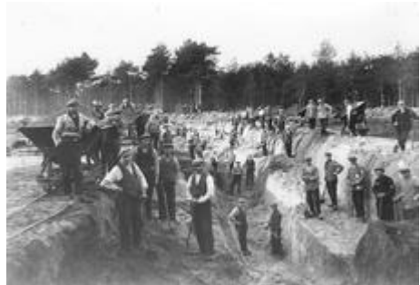
Aanleg Park Berg en Bos

Natuurpark Berg & Bos is een natuurpark van 250 ha groot aan de rand van het Veluwe heuvellandschap. Het in 1934 als werkverschaffingsproject aangelegde park is eigendom van de gemeente Apeldoorn. Het park toont de voor dit gebied karakteristieke planten en dieren zoals wilde zwijnen en edelherten.