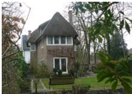
Huis De Valkhof