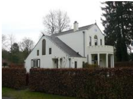
Villa de Halve Maan