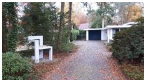
Bungalow door Gerrit Rietveld

4. Aan de linkerkant van de Montanalaan op nummer 8 bevindt zich een moderne bungalow die in 1957 is gebouwd door de bekende architect en meubelontwerper Gerrit Rietveld in opdracht van industrieel ontwerper A.R. Cordemeyer.