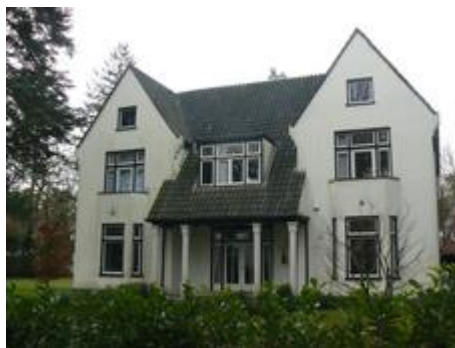
Villa door Henk Wegerif

Aan de linkerkant op nummer 16 staat een witgepleisterde villa met twee puntgevels en een veranda. Het werd in 1913 gebouwd door architect Henk Wegerif. De veranda's werden bij vele villa's in Apeldoorn toegepast, veelal op verzoek van de opdrachtgevers die uit Nederlands-Indië afkomstig waren en aan een veranda gewend waren. Vele vermogende Indiëgangers hebben zich voor de oorlog gevestigd in de nabijheid van de Apeldoornse bossen en het Koninklijk Huis.