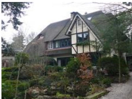
Engelse cottage stijl

Daar staan enkele huizen met hoge daken die karakteristiek zijn voor de jaren twintig en dertig van de vorige eeuw. Op nummer 142/144 links staat een dubbele villa met een rieten dak en rustiek vakwerk aan de gevel. De Holtense architect Loggers heeft zich laten inspireren door de Engelse cottage stijl. Engelse architecten hadden rond 1910 uitgesproken ideeën over het tuinstad concept. De burgerij moest in harmonie met de omringende natuur leven en de vorm en functie van de woningen moesten daaraan worden aangepast.