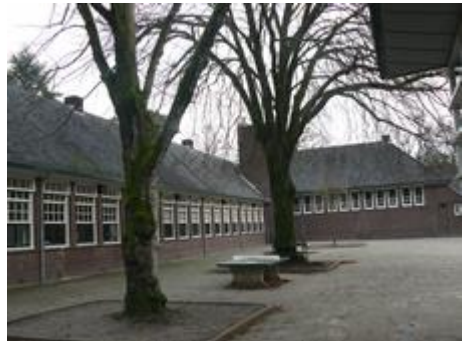
Berg en Bos school

Links aan de overkant op de hoek van de Burg. Roosmale Nepveulaan staat de openbare basisschool Berg en Bos die in 1932 is gebouwd. Met zijn rode bakstenen gevels en hoge daken is de school geheel aangepast aan de bosrijke omgeving en de villa-architectuur uit deze periode. De drie Hollandse of gewone lindes op het schoolplein aan de Soerenseweg staan op de gemeentelijke lijst Bijzondere Bomen vanwege hun leeftijd en de verbondenheid met het plein. Twee exemplaren zijn ruim 100 jaar. De derde is door een jong exemplaar vervangen.