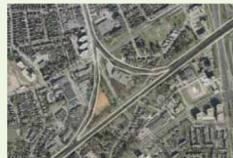
Op de actuele luchtfoto ter hoogte van de Koningin Beatrixlaan/Holthuis is het tracé van de Koningslijn ingetekend.

per trein bij het paleis konden komen. Omdat de spoorlijn dwars door het natte beekdal van De Grift en de Driehuizerspreng liep, moest deze ter plekke verhoogd worden aangelegd op een dijkje. De Koningslijn is een verborgen schat, die de gemeente langzaam in ere aan het herstellen is als fietsroute. Vlak vóór het fietspad dat de Waterloseweg verbindt met de Koningin Beatrixlaan ziet u in de bestrating de oude lijn terug. Op een deel van het traject tussen Apeldoorn en Vaassen is een fietspad gerealiseerd.