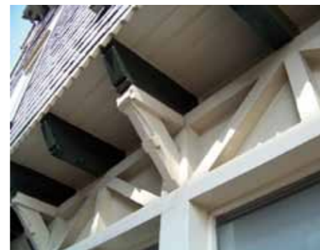
Door de glasstroken tussen de uitragende vloerbalken te herstellen, strijkt het daglicht weer langs het plafond van de winkel.

winkelruimte, die zich qua sfeer kan onderscheiden van het gangbare.