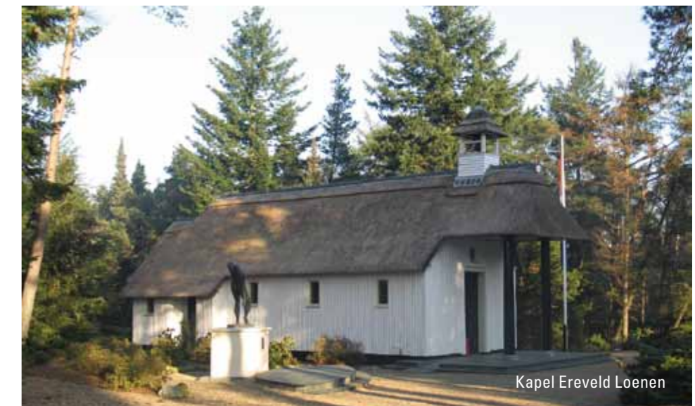
Kapel Ereveld Loenen

de loop van augustus verwachten op www.monumentendagenapeldoorn.nl . Voor vragen kunt u mailen naar: info@omdapeldoorn.nl .